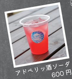
アドベリッ酒ソーダ 600 円