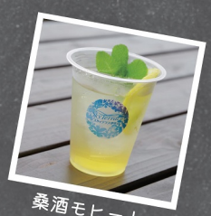
桑酒モヒート 600 円