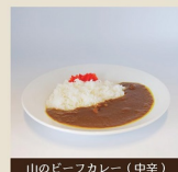
山のビーフカレー(中辛)