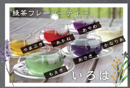
緑茶フレーバーティー