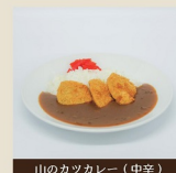
山のカツカレー(中辛)