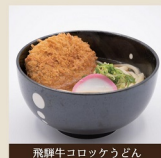
飛騨牛コロッセうどん